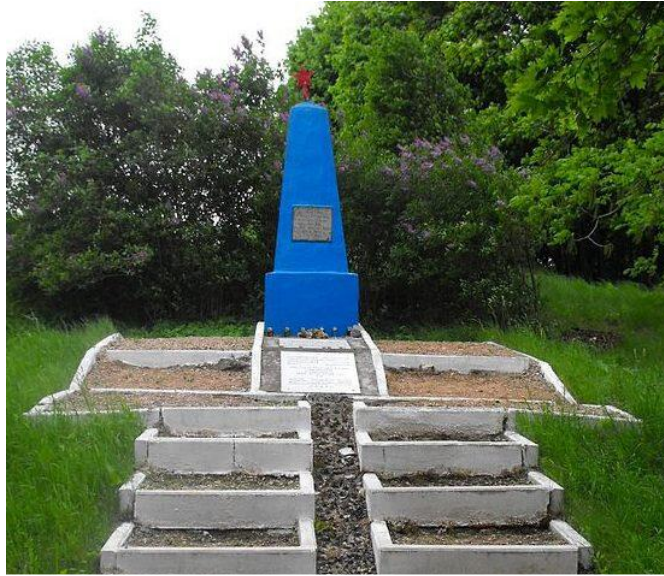
Мемориал «Расстрелянным немецко-фашистскими захватчиками мирным жителям городского посёлка Мир»