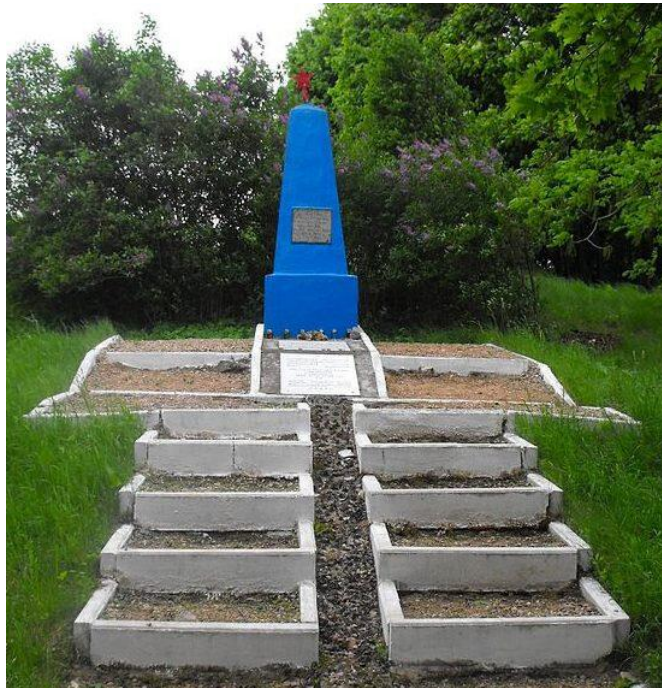
Memorial "To the residents of the town of Mir murdered by German fascist invaders "