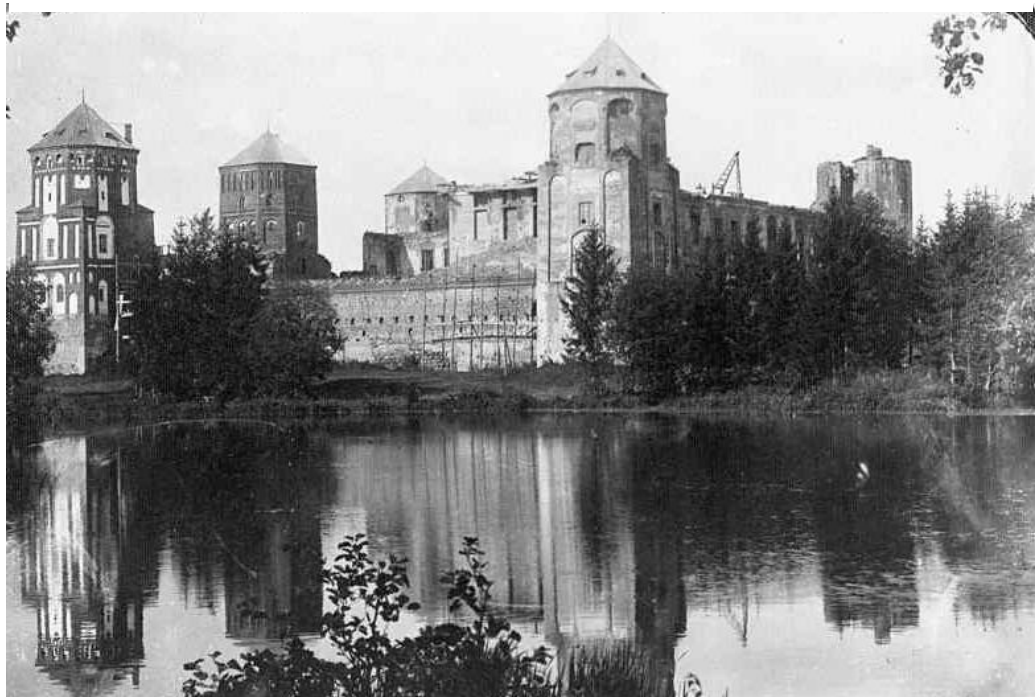
The Mir Castle

The war remained in the memory of my family, who at that time lived in the town of Mir in the Grodno region. At that time, the population of the settlement was predominantly Jewish. My grandfather often told me a story that he had heard in his early childhood. The Nazis created a Jewish ghetto on the territory of the Mir Castle, notorious for the mass killings of the local population. The medieval castle that once protected the town from enemies in the hands of the Nazis has turned into a place of mass execution. After the capture of Mir, people were not told where they would be taken, they were only ordered to gather in the main square of the town. Many did not take their personal belongings with them: they thought they would return home soon. Conditions in the ghetto were vicious: people were food deprived and were forced to work hard. The massacre was committed near the village of Yablonovshchina, near the town of Mir. Eyewitnesses report that on the day of the shooting, the water of the local lake of the same name was red with blood.